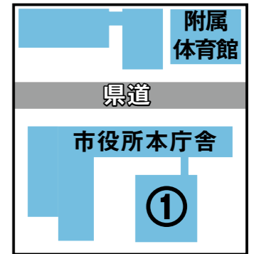
▲福祉産業部棟位置図

妊娠、出産から就学前児童までの窓口を一つにまとめ、切れ目のない子育て支援を行います！