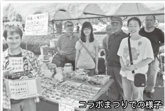
コラボまつりでの様子