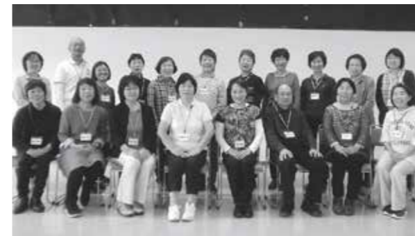
▲オレンジサポーターのみなさん