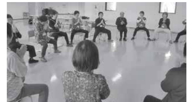
▲フォローアップ教室の様子