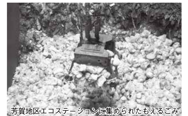
芳賀地区エコステーションに集められたもえるごみ

焼却するごみの量を減らすことは、天然資源の有効活用になります。また、地球温暖化の原因となる二酸化炭素の排出量を減らすことにつながり、環境への負担を減らすことができます。