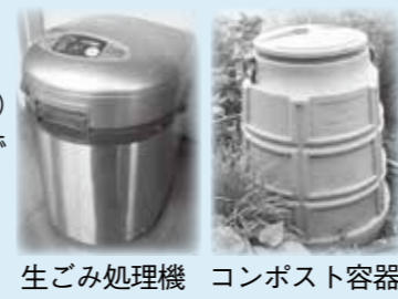
生ごみ処理機 コンポスト容器