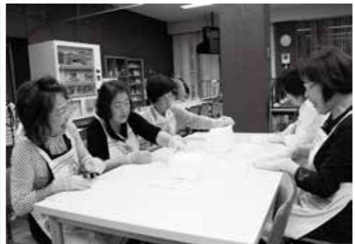
▲芳賀赤十字病院でのガーゼ折りたたみ作業

地域奉仕団で、私たちと一緒にボランティア活動に参加してみませんか。特に資格等の制限はありません。「住みよい地域を作りたい」、「助け合える地域を作りたい」という気持ちを持った人たちが組織されているボランティア団体です。興味のある方は、社会福祉課へお問い合わせください。