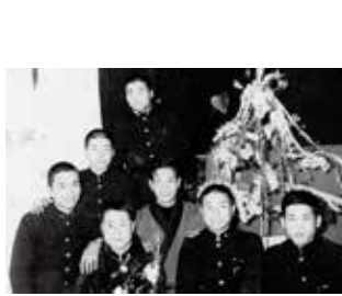
▲ボス会でクリスマス会 (左から2番目)

私は昭和10年に、8人兄弟の長男として山前村東沼に生まれました。小学生の頃は戦争が行われており、日赤の方面に焼夷弾が落とされた当時のことを今でも鮮明に覚えています。そんな時代でしたが、子どもだった私は、友達をたくさん集めて、みんなで野球を楽しんでいました。当然その当時に道具がしつかりそろそろもなく、全て手作りでした。グローブは布を縫い合わせて綿を入れたもので、ボールも綿を布で巻きつけた簡易的な