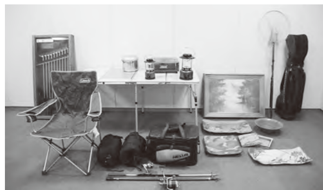
写真は公売財産の一部です。

災害や病気、失業などやむを得ない理由で税金を納期限内に納めることが困難な場合は、放置せずに、早めにご相談ください。