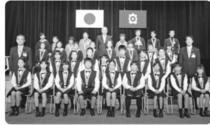
▲小学生の部受賞者