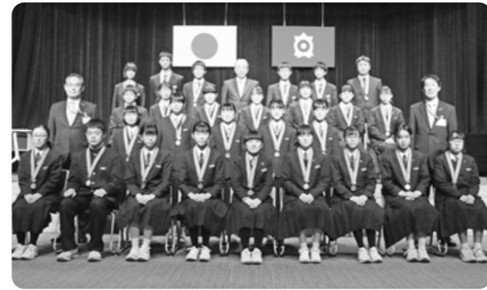
▲中学生・一般の部受賞者