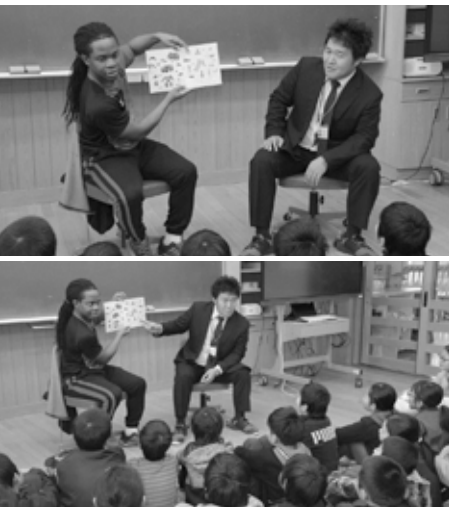
▲真岡小学校で行われた担任とAETによる英語の絵本の読み聞かせ

各小学校では、担任と外国人英語指導助手(AET)による絵本の読み聞かせを行うなど、児童たちが英語の絵本に慣れ親しみ、自然な英語の音やリズムに触れながら、英語を学ぶ活動が行われています。