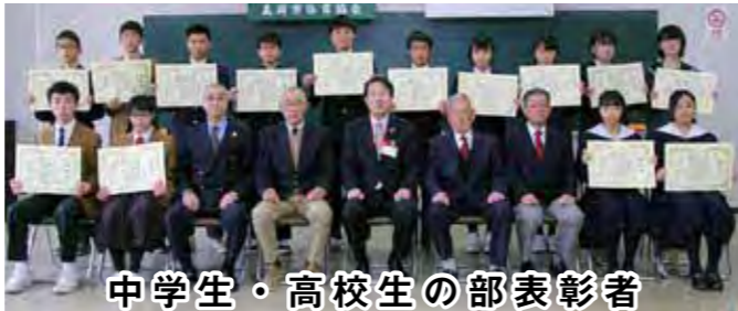
中学生・高校生の部表彰者