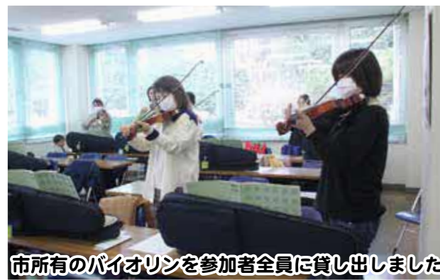
市所有のバイオリンを参加者全員に貸し出しました

初心者を対象としたバイオリン講座が行われました。全10回の講座で「キラキラ星」が弾けるようになることを目標としています。習い始めのころは音が出せなかった参加者も、9回目となる頃には、さまざまな音階が弾けるようになり、みんなでバイオリンの音色を楽しみました。