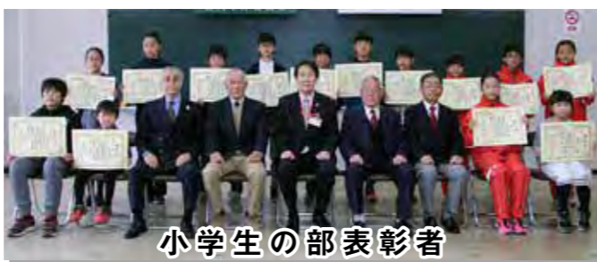
小学生の部表彰者

本市のスポーツ振興に多大な功績があった方や、県大会以上の大会で優秀な成績を収めた方など、今年度は80の方が表彰されました。