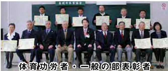
体育功労者・一般の部表彰者