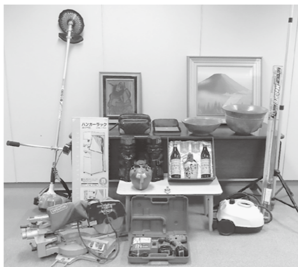
※写真は公売財産の一部です。