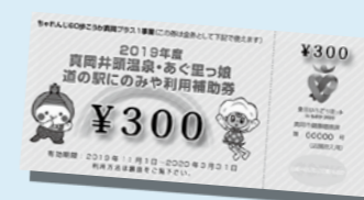
「300円分のお買い物券」