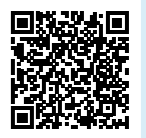
▲市ホームページ QRコード