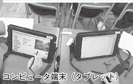
コンピュータ端末(タブレット)