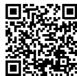
文部科学省 HP QRコード

★「GIGAスクール構想」について詳しくは、文部科学省ホームページを確認ください。