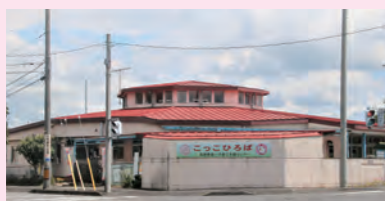
新庁舎周辺に整備される複合交流拠点への移転・複合化が予定されている田町の第一子育て支援センター(写真左/木造・築41年)と図書館(鉄筋コン造・築40年)