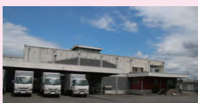
建て替えが予定されている第一学校給食センター(鉄筋コン造・築43年)

市内には昭和40年から50年代にかけて整備した公共施設が多く、それらの今後の方針は「大規模修繕による長寿命化」「建て替え」「移転・統合」「別用途で活用」「廃止・除却」などさまざまです。本市では、各施設の今後のあり方を示す「真岡市公共施設再配置計画」を平成30年3月に策定しており、令和4年度はその計画の見直し年度となります。現在の社会情勢や住民ニーズ等を踏まえ、中長期的な視点から効果的かつ効率的な公共サービスを提供するための検討を進めています。