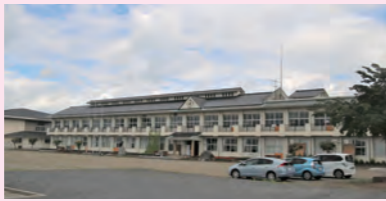
福祉施設や地域体育館として活用されている旧長沼北小学校(鉄筋コン造・築35年)