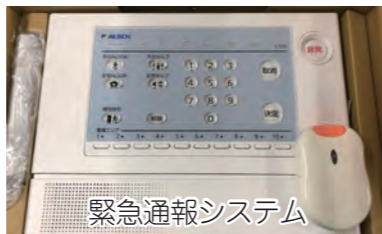
緊急通報システム

主要項目「電子自治体の推進」については、情報格差の解消と個人情報保護の保護に努めながら、高度情報通信技術を積極的に活用しています。