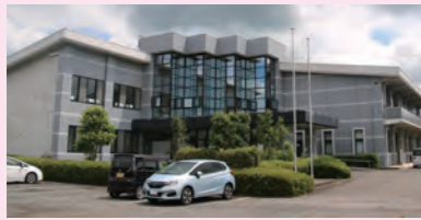
芳賀広域やひまわり園などを集約した旧コンピュータ・カレッジ(鉄筋コン造・築32年)

行政改革大綱については 総務課総務文書係Tel 83-8106 再配置計画については 財政課管財係Tel 83-8103