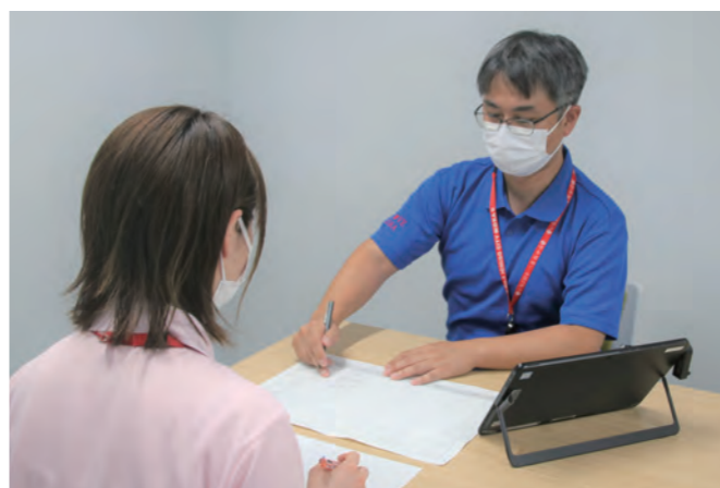
年2回以上実施される管理者との評価面談

職員は各自の職務職責に応じた適切な目標を設定し、その目標を自主的に管理します。また、管理者との評価面談を通じて人材の育成を図っています。