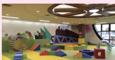
情報センターから子ども広場に用途替えした真岡駅舎内(鉄骨造・築25年)