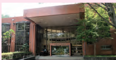
複合化が予定されている田町の第一子育て支援センター(写真左/木造・築41年)と図書館(鉄筋コン造・築40年)