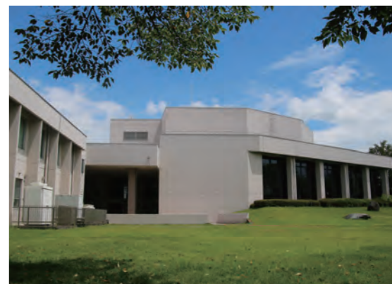
(株)ケイミックスパブリックビジネスが管理運営している真岡市民会館・市民会館

主要項目「事務事業の効率化」における民間委託等の推進については、令和2年度から、真岡市民会館(市民「いちご」ホール)、市民会館、青年女性会館に指定管理者制度を新たに導入しました。契約期間は令和7年3月までの5年間で、民間のノウハウを生かしながら3施設を一体的に管理することで、市民サービスの向上と行政コストの縮減を図っています。