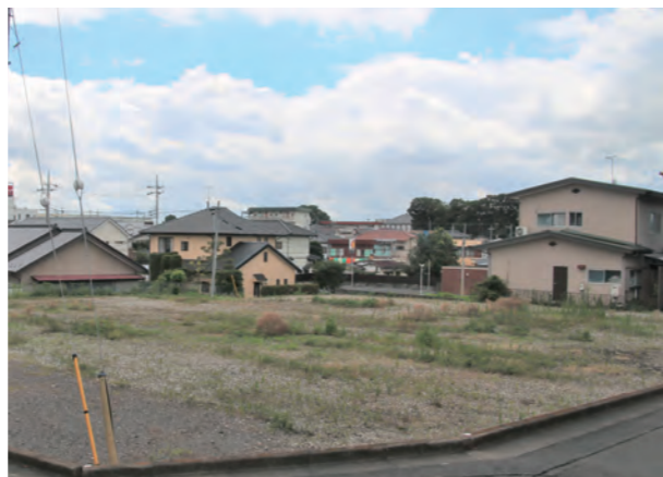
売却を進めている並木町団地跡地