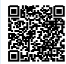
詳細や応募用紙ダウンロードはこちら