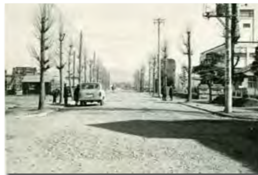
▲砂利道だった市役所前通り（昭和36年ごろ） 現在もある市役所前のキンモクセイが歴史を語る