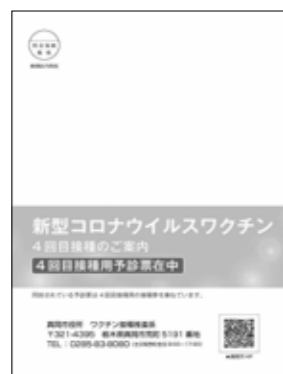
4回目のワクチン接種券（ピンク色の表紙）