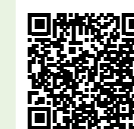
マタニティ セミナー