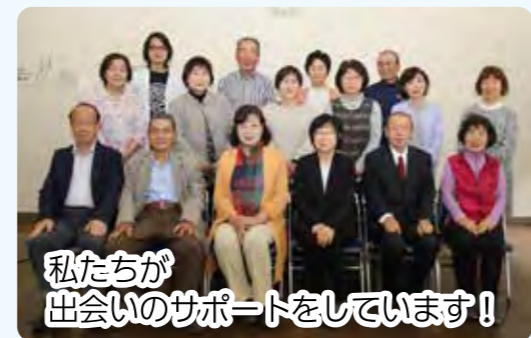
私たちが 出会いのサポートをしています！