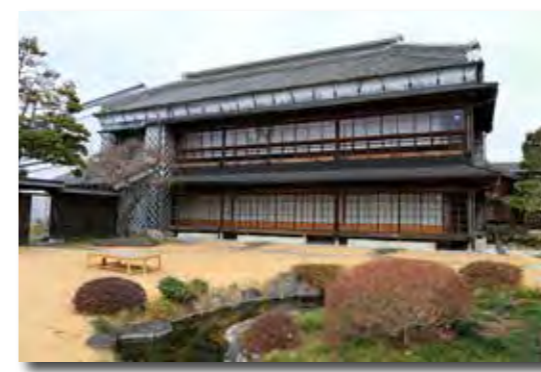
▲敷地内の池に農業用水を引き込んでいたこともあり、以前は川魚やホタルがいたそうです