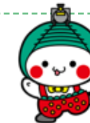
【令和3年度 ふるさと寄附金運用状況】