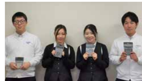
本社事業所(並木町)の同僚です