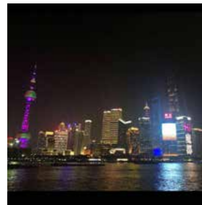
少し足を延ばして 上海の夜景も楽しみました