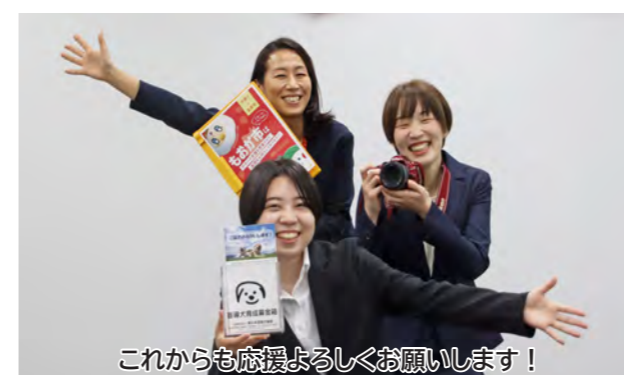
これからも応援よろしくお願いします！

市長 真岡市は県内移住者が比較的多いという特徴があります。理由はさまざまですが、要因の1つに、子育て支援や教育環境の充実があると考えています。保育施設はもちろんのこと、子ども広場や支援センターなどの遊び場・交流の場も整備されています。独自の教育施策としては、保育所で外国人講師による英会話レッスンを行っており、私立の幼稚園等にも英語教育の補助金を交付しています。また、小中学校では、国のGIGAスクール構想以前から電子黒板やタブレット端末を取り入れ、先進的な学習に取り組んでいます。そのほか、市内全ての中学校が海外の姉妹校等と交流するなど、国際交流が盛んですね。こうした取り組みは、他の自治体と比較しても