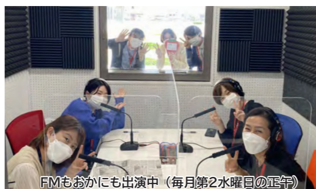
FMおかにも出演中（毎月第2水曜日の正午）

市長 犬についての講座は面白そうだね。私も実は犬を4匹飼っていて、それぞれ犬種が違うんだけど、みんな個性があってとてもかわいいんだよ。私もぜひ、褒め方やしつけのコツを教えてください。ドッグランも管理上の問題を解決して継続できればと思います。