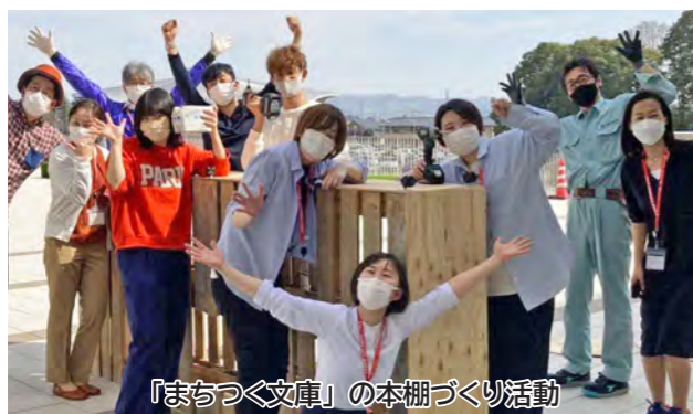
「まちつく文庫」の本棚づくり活動

市長 高評価ありがとうございます。「まちつく」は、若者たちに自分のまちに愛着を持ってもらおうと始めた事業ですが、公共空間を活用する社会実験が評価され、2022年のグッドデザイン賞を受賞することができました。