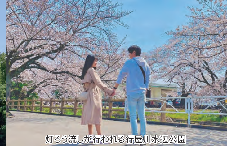
灯ろう流しが行われる行屋川水辺公園