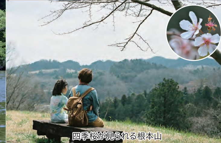
四季桜が見られる根本山