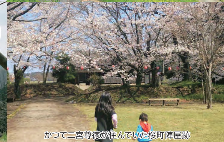
かつて二宮尊徳が住んでいた桜町陣屋跡