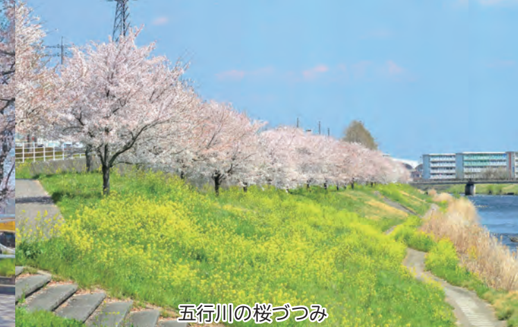
五行川の桜づつみ