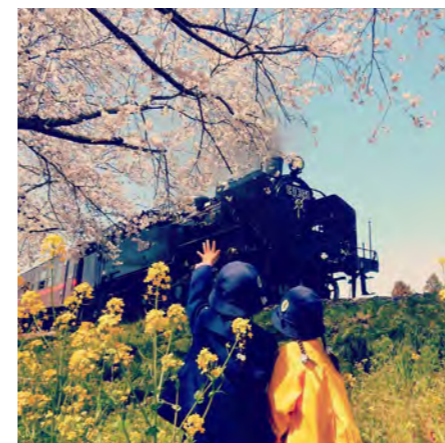
♡♡ # 真岡鐵道

ダイナム栃木真岡店 食品 JA はが野真岡地区、二宮地区女性会 食品 匿名 1,000円