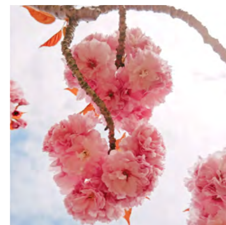
♡♡ # 熊倉公園