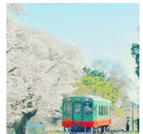
♡♡ # 真岡応援カメラマン