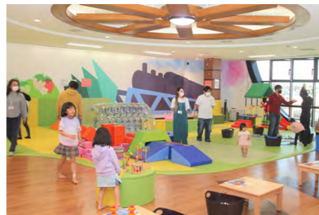
真岡駅子ども広場 利用時間: 平日 10:00~12:00、13:00~17:40 土日祝日クール制 休館日: 火曜日(祝日の場合は翌平日)

真岡駅のSL型駅舎内に開設している室内遊び場です。対象は0歳~小学2年で、乳幼児専用ゾーンもあるので安心して遊べます。授乳室・おむつ替えスペースも完備。料金無料。