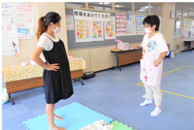
マタニティセミナー(こども家庭課母子健康係)

出産前に国から支給される「出産・子育て応援金」50,000円に加え、胎児一人あたり20,000円を支給します。