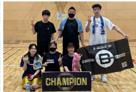
休日はバスケットリフレッシュ