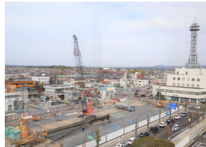
工事が始まった市役所北側の建設予定地(4月5日現在)

令和7年春の開館を目指す複合交流拠点施設の整備運営事業の起工式が、建設予定地で行われ、石坂市長をはじめ関係者たち約50人が工事の安全を祈願しました。式典にあたり市長は「市民にとって新たな学びの拠点となるよう、工事の安全と円滑な進捗を祈念します」とあいさつしました。(問・プロジェクト推進課複合交流拠点整備係 Tel 83-8059)