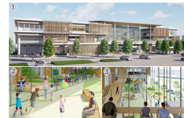
令和7年春の開館を目指す複合交流拠点施設のイメージ図 ※9ページに関連記事