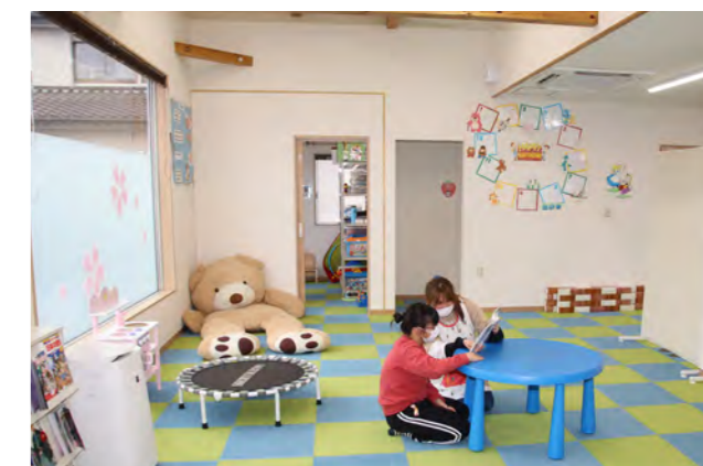
放課後等デイサービス(社会福祉課障がい福祉係)

支援を要する児童を対象とする児童発達支援、放課後等デイサービスなどを自己負担なしで利用できます。