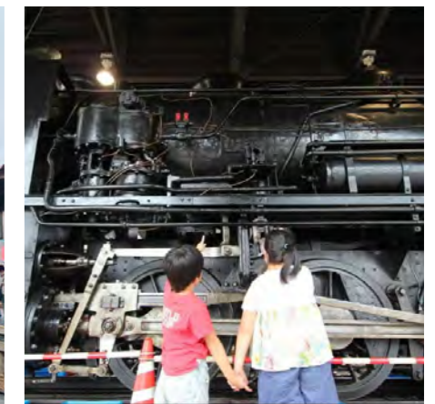
♡Q▽ # 真岡のSL