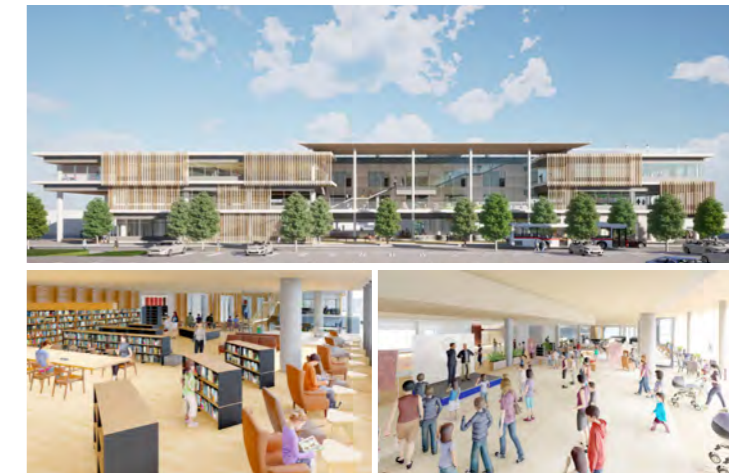
複合交流拠点の外観と各フロアの完成イメージ