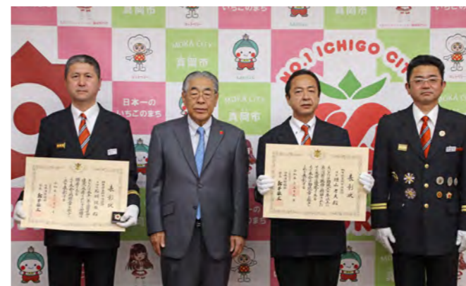
左から、石川分団長、石坂市長、増山団員、横田副団長