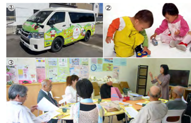
①もおかベリー号 ②中核的な療育施設を目指すこども発達支援センター ③まちなか保健室

「もおかベリー号」実証運行事業 こども発達支援センター運営委託事業 まちなか保健室事業