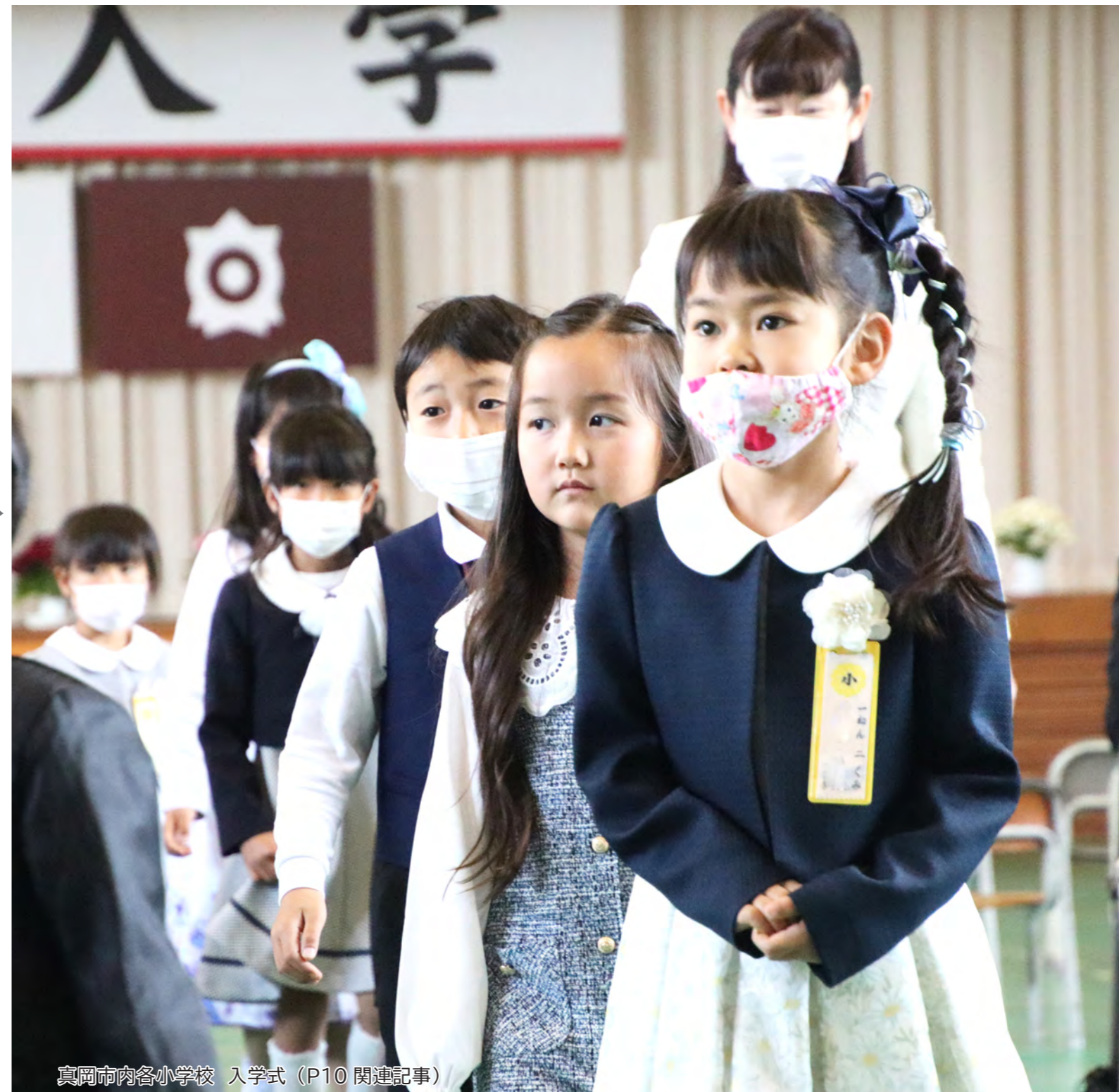
真岡市内各小学校 入学式 (P10 関連記事)

広報もおか 816号 / 令和5年5月1日発行 / 発行人 真岡市長 石坂真一 / 編集 秘書広報課広報広聴係 〒321-4395 栃木県真岡市荒町5191 / TEL 0285-83-8100 / FAX 0285-83-5896 / HP https://www.city.moka.lg.jp/