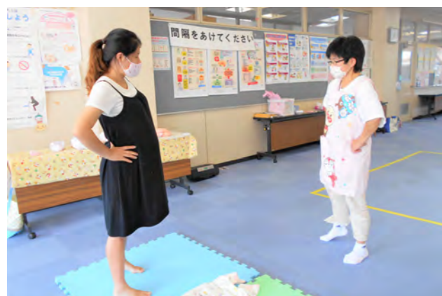
マタニティセミナー(こども家庭課母子健康係)

出産前に国から支給される「出産・子育て応援金」50,000円に加え、胎児一人あたり20,000円を支給します。