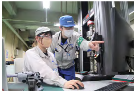
班員の目線でアドバイス