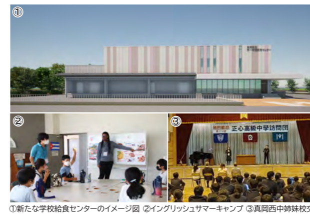
①新たな学校給食センターのイメージ図 ②イングリッシュサマーキャンプ ③真岡西中姉妹校交流

学校給食センター整備事業 英語指導助手配置事業 教育交流訪問団受け入れ・派遣事業