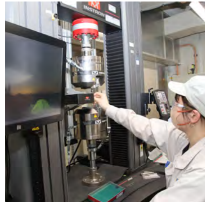
アルミ板強度をみる引張試験