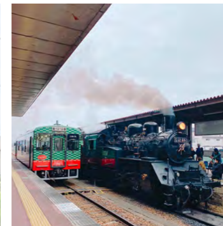
♡Q▽ # 真岡鉄道応援団