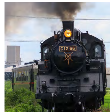
♡Q▽ # 蒸気機関車 # 機関車