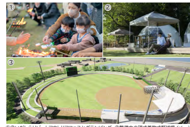
①いがしらリゾートアウトドアフェスとグランピング ②整備中の硬式兼軟式野球場イメージ図

いがしらリゾート活性化事業 総合運動公園整備事業 市HP、アプリ等による情報発信事業