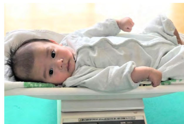
1カ月児健康診査(こども家庭課母子健康係)

こども医療費の対象外となる生後1カ月児の健康診査費用を最大5,000円助成します。