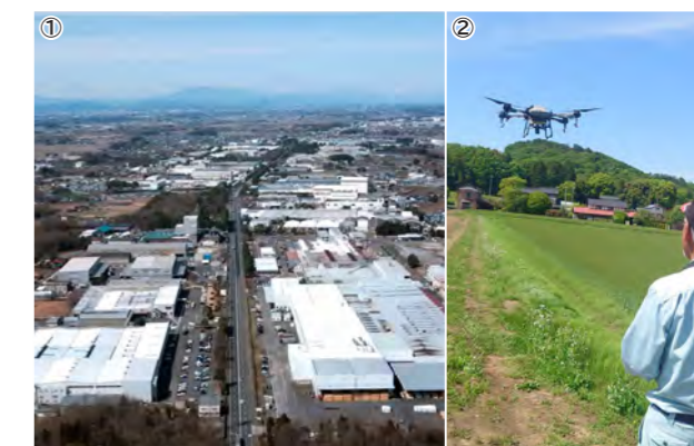
①産業団地整備区域の北側に広がる工業団地 ②スマート農業で活用が期待されるドローン

産業団地整備事業 いちご等生産施設整備支援事業 ICT機器等を活用したスマート農業導入支援