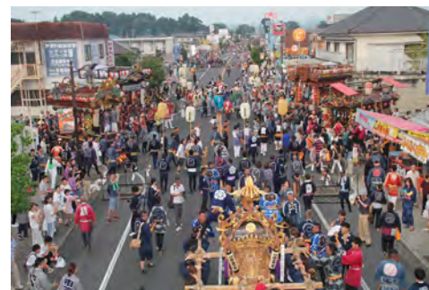
宮入り献燈 23日(日) 17:20～ 灯入れ 23日(日) 18:50～