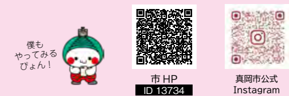
僕もやってみよう！

Instagramまたはフェイスブックのご自身のアカウントで「#真岡応援カメラマン」「#mokafan」をつけて写真を投稿してね。