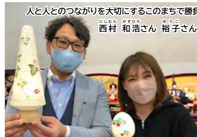
人と人のつながりを大切にするこのまちで勝負