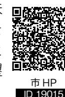
市 HP ID 19015

【お二人】 まちの良い所を伸ばし、未来へ向けて子どもがやりたいことを実現する際、身近な大人が受け皿となり、しっかりサポートできる希望に満ちたまちになってほしいです。