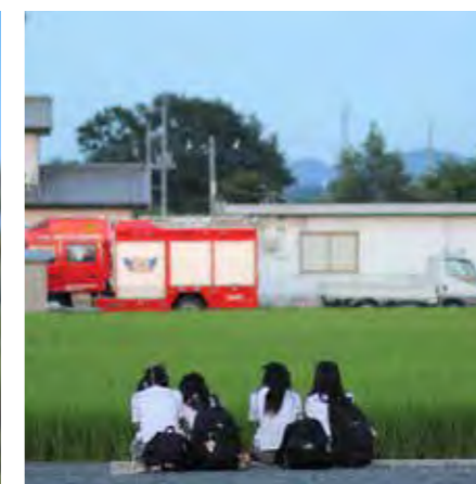
♡♡♡ # 真岡の景色 # 真岡の夏