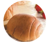
いちごバターロール (しほの)