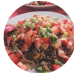
真岡いちご飯 チャーハン(文珍楼)