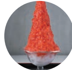
世界一を目指すかき氷(寿氷)