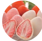
恋するいちご (もめん茶屋)