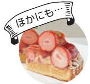
タルト (アントル・ヴェリテ)