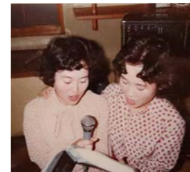
双子のお姉さんと

わが家はお客さまが多く、料理でおもてなしをしていた母の影響で、料理が好きになり、真岡女子高の家政科へ進学しました。調理の授業は楽しく、時々家族に手料理をふるまい、「美味しかった」と言ってもらえると、幸せを感じるようになったのも母のおかげですね。