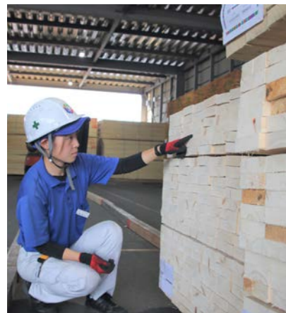
入荷数と大きさの確認作業