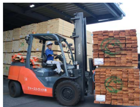
フォークリフトを操縦・運搬