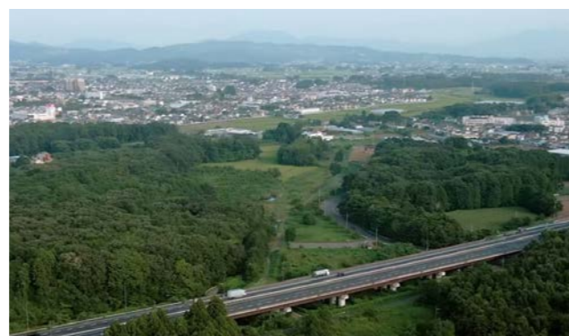
真岡IC付近上空から望む「自然ふれあい園久保」