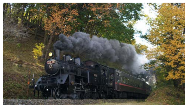
休日を中心に通年運行しているC12形SL