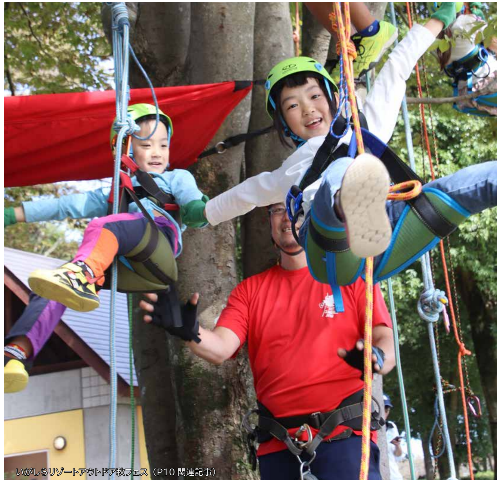
いがしらリゾートアウトドア秋フェス (P10 関連記事)

広報もおか 823号/令和5年12月1日発行/発行人 真岡市長 石坂真一/編集 秘書広報課広報広聴係 〒321-4395 栃木県真岡市荒町 5191 / TEL 0285-83-8100 / FAX 0285-83-5896 / HP https://www.city.moka.lg.jp/