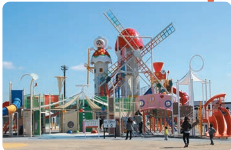
真岡ハイトラ運動公園(総合運動公園)子ども広場

真岡ハイトラ運動公園陸上競技場の東側に位置する「子ども広場」は、1～3歳、3～6歳、6～12歳の3段階の年齢層にエリア分けされ、それぞれの年齢にふさわしく安全な遊具をそろえています。料金は無料。⇒P113