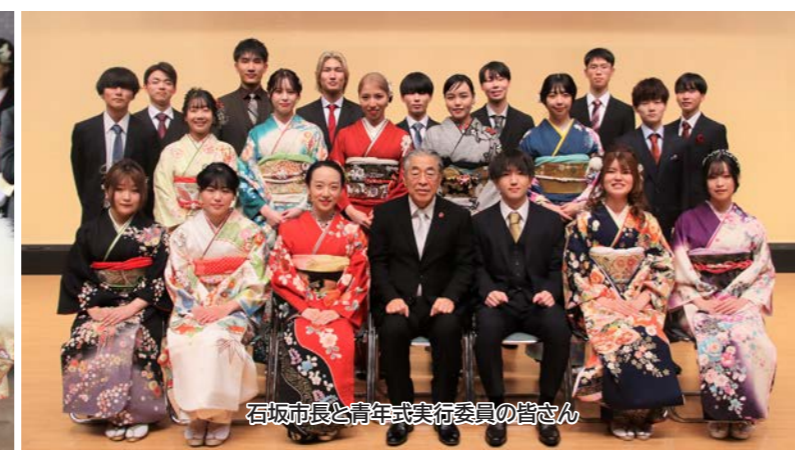
石坂市長と青年式実行委員の皆さん