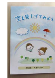
4 作品目の歌集 「空を見上げてみよう」

いつの間にか書くことが生きがいとなり、現在も年に数回、投稿を続けているほか、自身の詩集や投稿文などをまとめた本を出版しています。1 作品目の詩集は東北の被災地に、その後 2・3 作品目は、市内の中学校、市役所、JA などに贈りました。そして、4 作品目はコロナ禍で医師や看護師の皆さんにお世話になったことを思い出し、短歌を詠み、本づくりに励み完成させて、昨年 5 月に芳賀赤十字病院や医療関係者に寄贈しました。その時の礼状や記念写真は私の宝物です。こうして 4 冊の本を自費出版できたこと、そしてその都度、新聞に掲載していただいたことに感謝です。来年は喜寿を迎えます。たった一度の人生。これからも目標に向かって一歩ずつ進み、出会いを大切にしながら元気に楽しく過ごしたいと思っています。