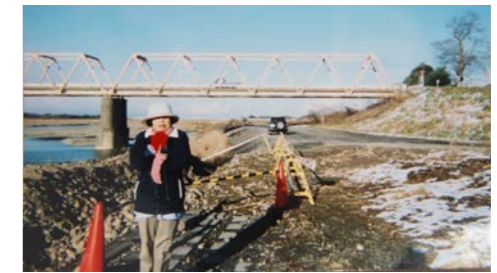
◀鬼怒川を渡り新生活を始めた頃 (旧大道泉橋)

執筆を始めたのは、再就職した会社を約 20 年勤め、子育ても一段落した頃です。心