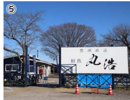
①お刺身盛り合わせ ②真あじ ③店内様子 ④スタッフの皆さん ⑤店舗外観・看板

【所在地】東郷 756 【駐車場】20 台程度 【営業時間】11:00~19:00 【定休日】水曜日 第1日曜日 【電話】090-1229-0930