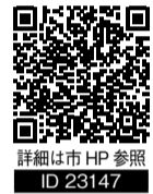
詳細は市HP参照 ID 23147

真岡市の友好都市ハーヴィー市の魅力をバーチャル体験! まちなみや特産品の紹介など、ハーヴィー市に行った気分を味わえます。ご自宅のPCやスマートフォンからご視聴ください。 【とき】9月14日(土)午前10時～11時30分 【対象】市内在住、通勤・通学の方 抽選100組 【申込】8月23日(金)までに応募フォームで受付【参加費】無料(お土産付き) ※PC等から視聴できない場合、本庁舎404会議室で視聴可 ☎ 真岡市国際交流協会(くらし安全課内) Tel 83-8719