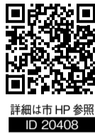
詳細は市HP参照 ID 20408

【とき】10月20日(日)午前10時～午後4時(予定) ※今年度は1日のみの開催で実施 ※出演団体数により日程が変更になる可能性あり 【ところ】KOBELCO 真岡いちごホール大ホール 【募集ジャンル】ダンス(フラ、ハワイアン、よさこい、四つ竹、バレエ、ヒップホップ等)、音楽全般(演奏を伴うもの)、伝統芸能、朗読、民謡・民舞、吟詠剣詩舞、日本舞踊 【参加資格】以下のいずれかに該当すれば申込可 ・真岡市文化協会会員の方 ・市内在住・通勤・通学している方 ・市内施設を主な活動の場とする団体に所属する方 【申込】8月15日(木)までに出演申込書(文化課・公民館・各分館・市HPで入手)に必要事項を記入し、事務局(文化課)へ直接持参またはFAX、メールで受付 ※出演者名の欄は必ず本名を記入 ☎ 文化課文化振興係 Tel 83-7732 FAX 83-4070 メール bunka@city.moka.lg.jp