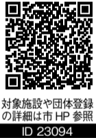
対象施設や団体登録の詳細は市HP参照 ID 23094

8月1日(木)から市の公共施設等を利用する際、各種障害者手帳またはミライIDを提示すると、使用料等が减免されます。また、障がい者団体なども事前登録することで减免を受けられます。 【対象】身体障害者手帳・療育手帳・精神障害者保健福祉手帳のいずれかをお持ちの方 ☎ 社会福祉課障がい福祉係 Tel 83-8129