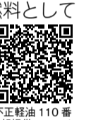
不正軽油110番情報提供フォーム