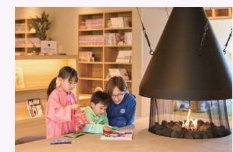
真岡いがしら温泉 おふる café いちごの湯