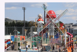
真岡ハイトラ運動公園 子ども広場