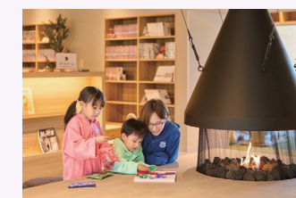
真岡いがしら温泉 おふる café いちごの湯