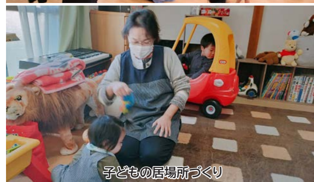
子どもの居場所づくり