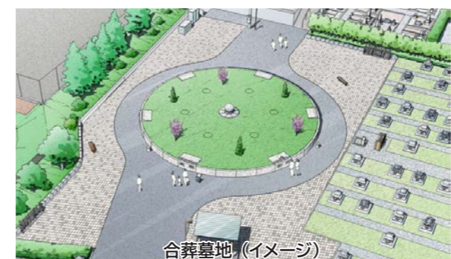
合葬墓地（イメージ）

もおかベリー号の運行 2,579万円 中心市街地と周辺地区を結ぶ「もおかベリー号」を運行 （総合政策課）