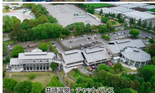
井頭温泉・チャットパレス