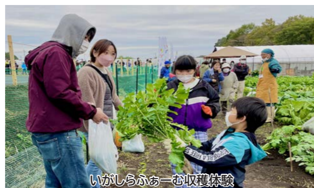
いがしらふぁーむ収穫体験

新 市制施行70周年記念事業いちごハッピー フェスティバル（仮称）の開催 5,000万円 市制施行70周年記念事業を開催し、市内外に真岡の魅力 を発信（総合政策課）