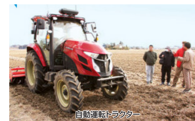
自動運転トラクター

日本一のいちごのまちPR 720万円 SNSやデジタル広告などを活用し、日本一のいちごのま ち真岡市の情報を発信（秘書広報課）