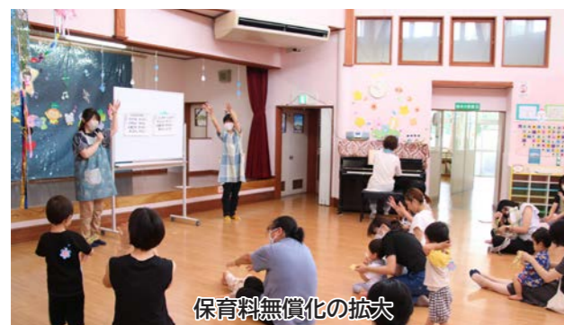
保育料無償化の拡大