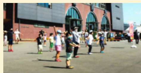
真岡駅前ではラジオ体操

市内各地区には健康づくりを推進する健康推進員さんがいます。真岡市では150人の方が任命されており、ラジオ体操や健康ウォーキング、健康講話の実施などそれぞれの地域で活躍しています。