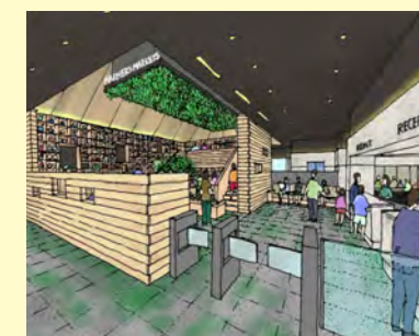
自動入退館システムの導入

真岡井頭温泉とチャットパレスは、㈱温泉道場と連携して、カフェのおしゃれ感とスーパー銭湯のリラクゼーションを融合させた「お風呂 café」を目指し現在整備を進めています。