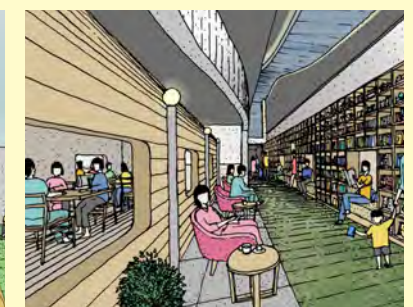
全館 Wi-Fi 完備やフリースク コーナー、豊富な書籍