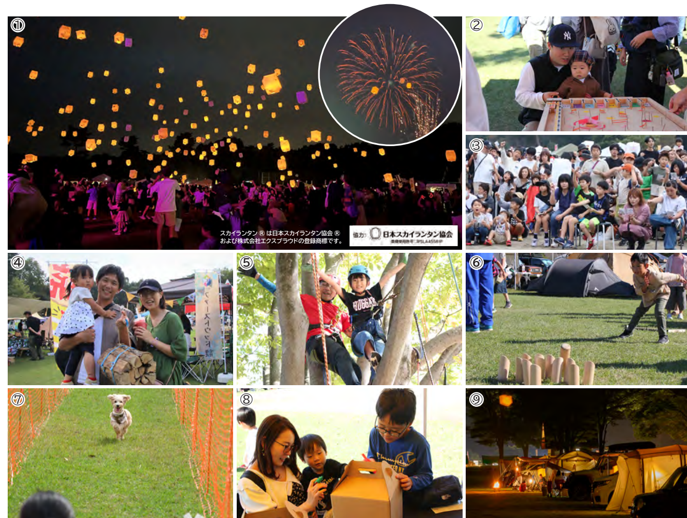
①スカイランタン®と花火のコラボ ②いがしらリゾートブース ③ビンゴ大会 ④アウトドアグッズ販売 ⑤ツリークライミング ⑥モルック ⑦イヌリンピック ⑧段ボールを使った燻製作り ⑨キャンプ宿泊

真岡市 70 周年と井頭公園 50 周年の記念事業として、いがしらリゾートで「アウトドア秋フェス」が盛大に開催されました。会場には、アウトドアグッズやワークショップ、アクティビティ、グルメなどが勢ぞろいしました。また、市制 70 周年を祝して花火とスカイランタン®の共演なども行われ、アウトドア初心者や家族連れ、犬連れの方まで思いっきり自然を楽しみました。(問・プロジェクト推進課いがしらリゾート推進係Tel 83-8196)