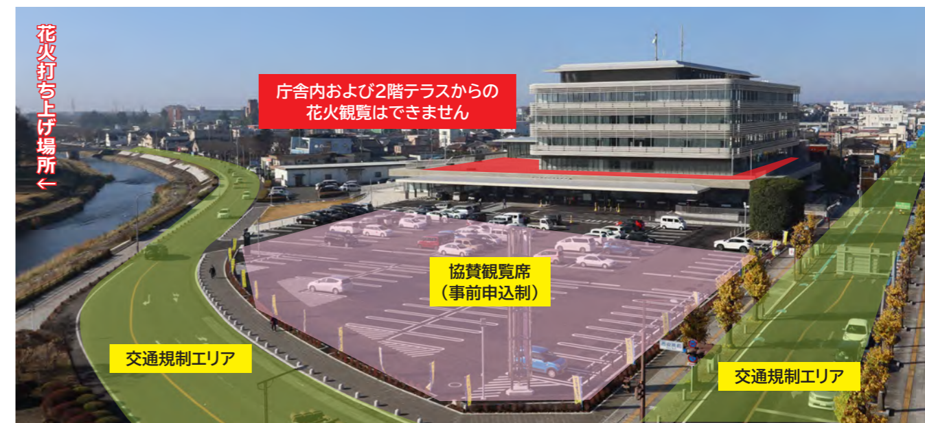
※花火大会のため7月26日(土)は複合交流拠点施設「monaca」が休館となります。