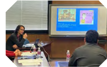
登録男性限定 出会いを生かす スキルアップ講座

令和6年度は、男性向けに「出会いを生かすスキルアップ講座」、女性向けに「第一印象アップ講座&パーソナルカラー診断」を開催しました。婚活だけでなく、さまざまなシーンで生かせる内容となりました。