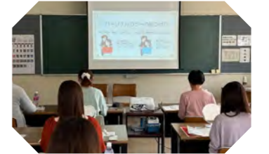
女性限定 第一印象アップ講座& パーソナルカラー診断