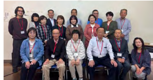
わたしたちがサポートします