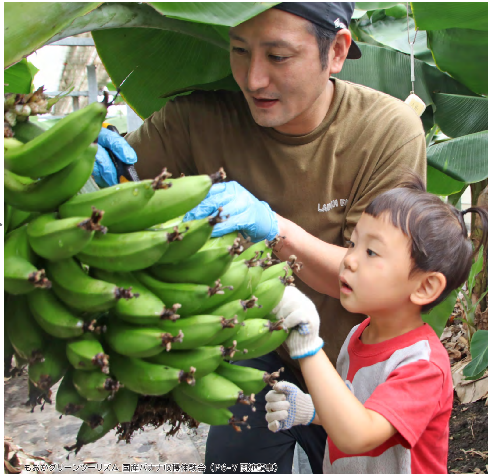
もおかグリーンツーリズム 国産バナナ収穫体験会 (P6-7 関連記事)