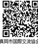
真岡市国際交流協会 facebook