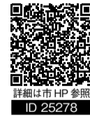
詳細は市HP参照 ID 25278

『もっと行きたくなる真岡へ』をテーマに、Googleビジネスプロフィール活用セミナーを開催。初心者から経験者まで、実践的な活用方法を学べる内容です。 【とき】9月30日(火) 〔午前〕一部10:00～10:45/二部11:00～11:45 〔午後〕一部14:00～14:45/二部15:00～15:45 【内容】一部 始めてみよう編 / 二部 活用編 ※一部のみ、二部のみ参加も可能 【ところ】複合交流施設 monaca 会議室 【定員】各回先着40人 【参加費】無料 【申込】9月26日(金)までに、市HP内申込フォームで受付 ※セミナー参加者は改善の伴走支援へ応募可能 ☎ 商工観光課観光係 Tel 83-8135