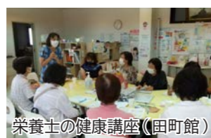
栄養士の健康講座(田町館)