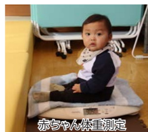
赤ちゃん体重測定

まちなか保健室は「赤ちゃんの駅」も兼ねています。ベビースケール(赤ちゃん用体重計)や授乳・おむつ替えスペースも自由に利用できます。