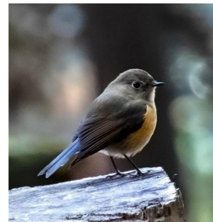
♡Q▽ #ルリビタキ(井頭公園)