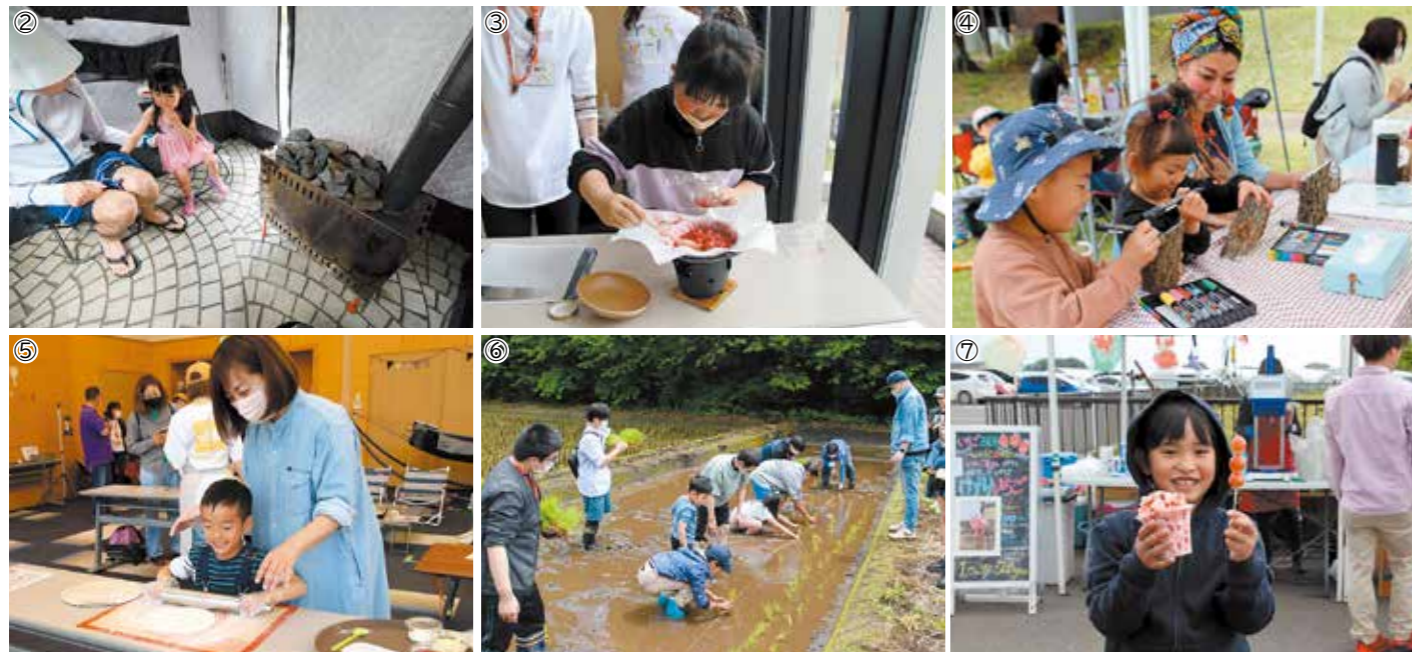
①メイン会場 ②テントサウナ ③いちごジャム作り ④切り株アート ⑤ピザ生地作り ⑥田植え体験 ⑦けずりいちごといちごあめ