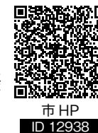
市 HP ID 12938

第二世代のまちづくりとは、言ってみればまちづくりの民主化。プロではなくても、SNSなどで発信ができる時代。もちろん失敗することもあります。それさえも活動の成果として楽しめると思います。正解へは実際に行動しないと近づけないのがまちづくりですから。