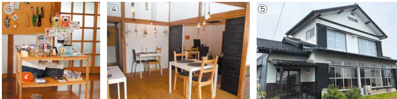
①ランチプレート ②マーブルバナナケーキ (左) と濃厚ミルクプリン ③手作り雑貨小物 ④店内の様子 (14席) ⑤店舗外観