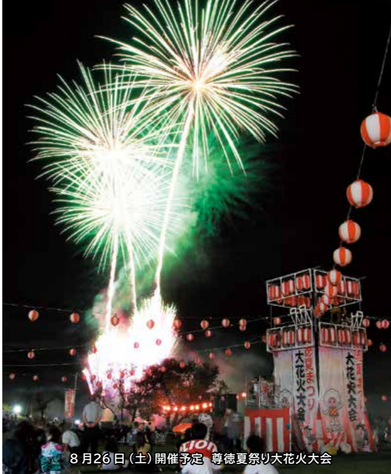
8月26日(土)開催予定 尊徳夏祭り大花火大会