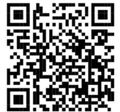
救急車の適正利用について(県HP)

意識障害、けいれん、飲み込み、事故 など いつもと違う場合、様子がおかしい場合特に高齢者は自覚症状が出にくい場合がありますので、注意が必要です。